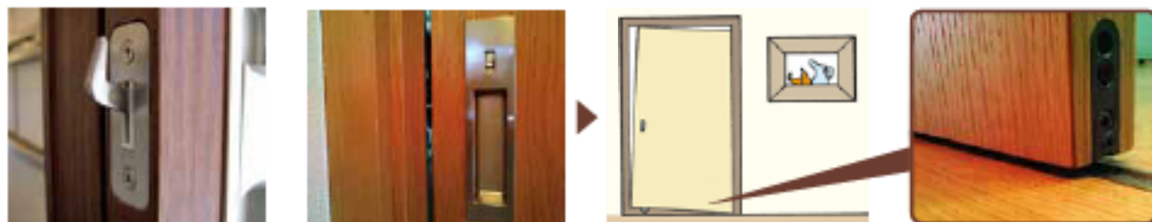
隙間が原因で鍵が掛からなくなる