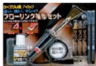
補修セット(かくれん棒PRO)