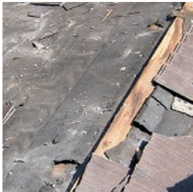
①防水シートの破れ