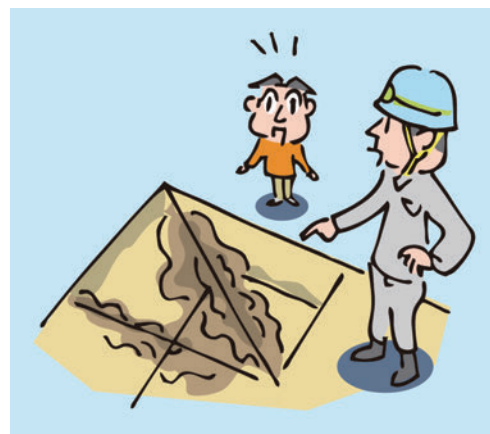
漏水による野地板の腐食