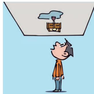
天井からの雨漏れ